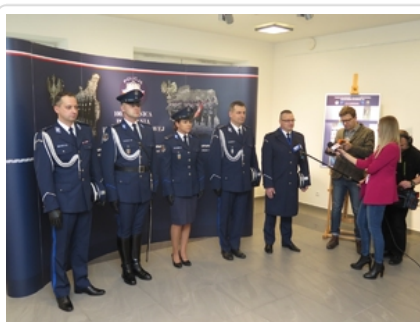
Nowe mundury wyjściowe podczas prezentacji w siedzibie Biura Historii i Tradycji Policji KGP