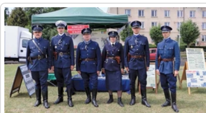
Dzisiejsi rekonstruktorzy chętnie zakładają mundury Policji Państwowej. My możemy teraz porównać wzór z okresu międzywojennego z zaprezentowanym w 2019 r.