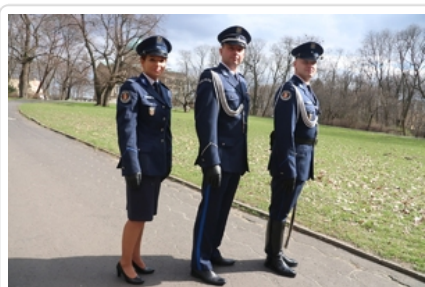
Przy doborze koloru odwołano się do przedwojennych tradycji, ale wybrano odcień o większym nasyceniu barwą