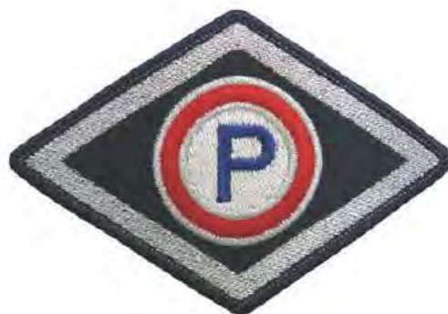
Służba prewencyjna (z wyłączeniem komórek organizacyjnych ruchu drogowego)