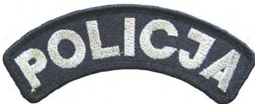
Znak do kurtki galowej i płaszcza wyjściowego całorocznego