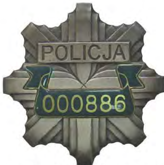
Znak identyfikacji indywidualnej policjanta