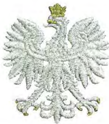
Znak generalnego inspektora i nadinspektora Policji