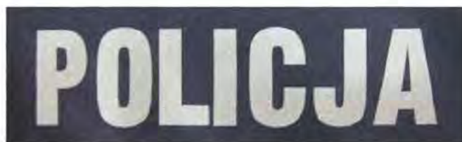
Znak do elementów ubioru służbowego i munduru ćwiczebnego