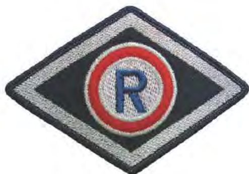
Służba prewencyjna (komórki organizacyjne ruchu drogowego)