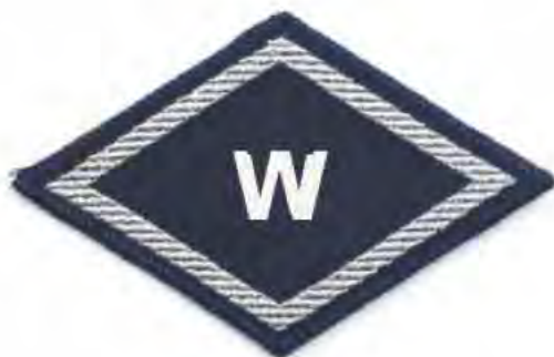
Służba spraw wewnętrznych