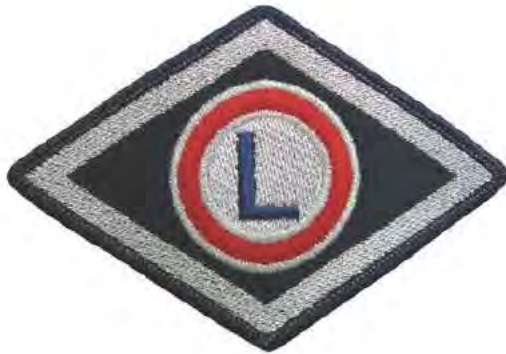
Służba wspomagająca, Wyższa Szkoła Policji w Szczytnie, szkoły policyjne i ośrodki szkolenia Policji