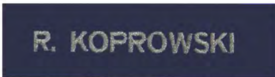
Znak identyfikacji imiennej w postaci taśmy szczepnej